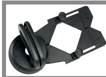
DIMA DI FORATURA